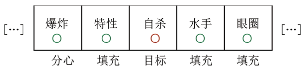
图 1 学习阶段刺激呈现流程图 (以词汇为例)