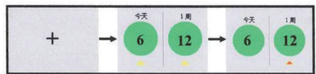
图 1b 跨期选择任务流程示意图